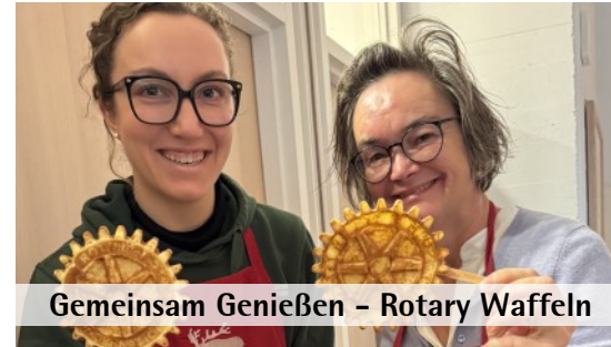
Gemeinsam Genießen – Rotary Waffeln