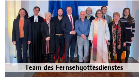
Team des Fernsehgottesdienstes

Liebe ehrenamtliche und hauptamtliche Mitarbeiterinnen und Mitarbeiter, für Ihren Einsatz in den vielfältigen Bereichen unserer beiden Gemeinden und das schöne Miteinander danken wir Ihnen und Euch von ganzem Herzen. Mich spricht die Ausführung des Weihnachtsmotivs dieser Karte an: Unsere Gemeinschaft ist wie ein Mosaik, welches von Gott immer wieder neu gestaltet wird. Jedes „Steinchen“ hat Glanz und Charme. So kann sich auch das Kommen Gottes ereignen: Vielfältig, glitzernd und – wenn die Zeit gekommen ist – passgenau.